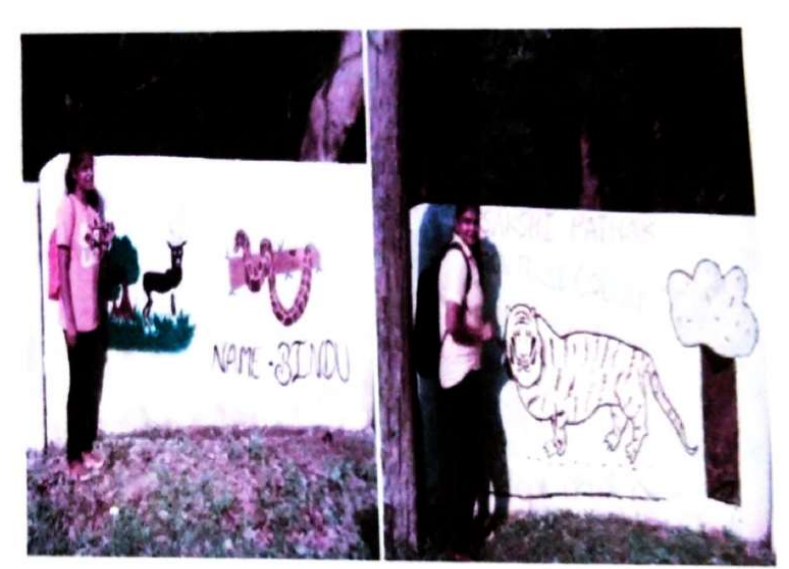
प्रतिभागी छात्र अपने पेंटिंग के साथ